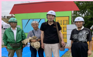
←ドローンで上空から中洲に取り残された人の様子を確認