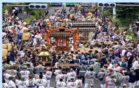
市内6つの神輿会が担ぐ6基の神輿が練り歩く様子は圧巻です