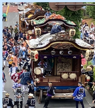
豪華な屋台3台と山車2台の巡行。色々な催しが各所で行なわれるので全部見るのは至難の業でした