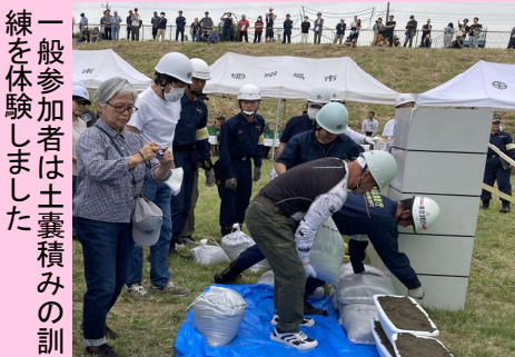
一般参加者は土嚢積みめの訓練を体験しました