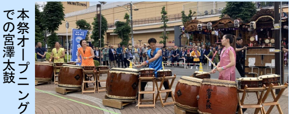
本祭オープニングでの宮澤太鼓