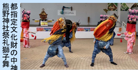
都指定文化財の中神熊野神社祭礼獅子舞