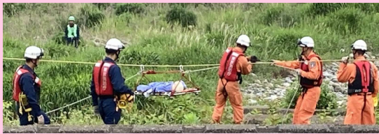
ロープを張って無事被災者を救助しました