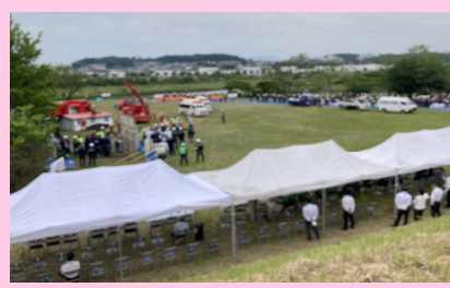
一般見学者と土手から見た訓練会場