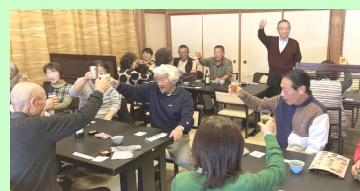
まずは志村会長の挨拶と乾杯！