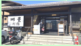
屋敷処川豊別館は大中小の部屋がある大きな店でした