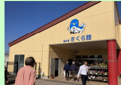
美味しいウナギを堪能した後は、成田空港近くの空の駅さくら館へ。ここでも飛行機見物よりお買い物？