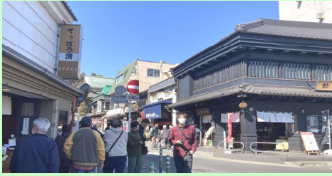
ずらりと土産物屋が並んだ門前商店街 右の黒い店は地酒の酒造です