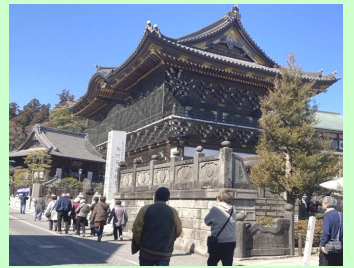
新勝寺の大きな総門に到着