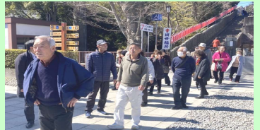
記念撮影後、大本堂に向かうまでは皆さんまとまっていたのですが、後は自由行動に