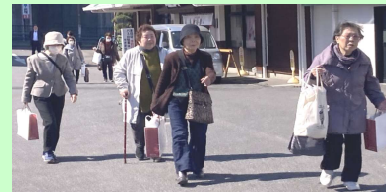
駐車場に戻ると、山のように土産物を持った皆さんが次々と帰還。見物より買物が主だったのかも