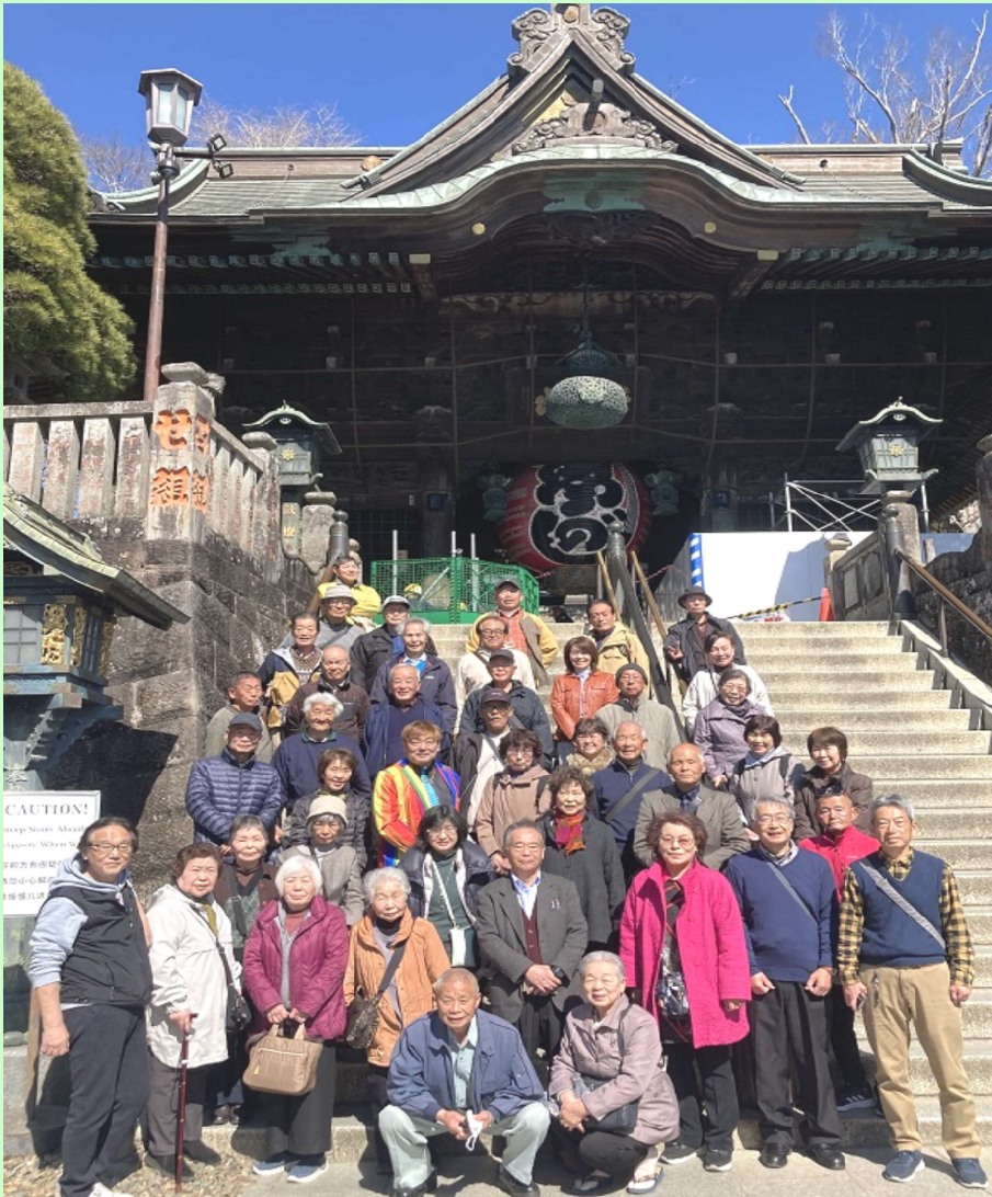
成田山新勝寺に到着後、自由行動の前に仁王門前の階段で参加者全員の記念撮影