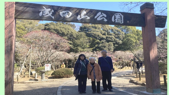
結局ここで出会えたのはほんの数人でした