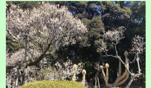
梅が見頃という成田山公園で待ってみることに