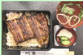
待望のウナギ登場！！