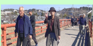
屋敷のウナギを食べる前に駐車場から根木名川沿いを軽くお散歩