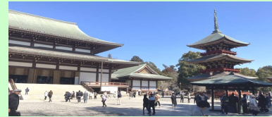
とにかく境内は広過ぎてどこへ行ってよいやら散り散りの参加者を探すのは至難の業