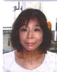
市事務 もろた 師田 まゆみ まゆみ