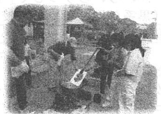
地区委員会のキャンプ