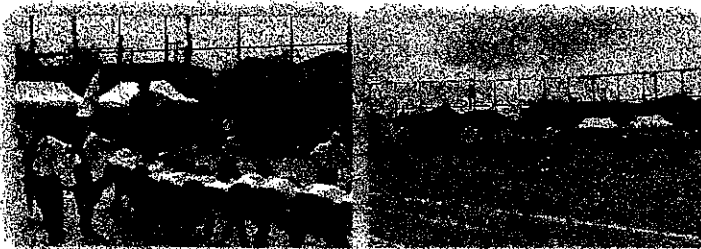
1年学年種目 いかだ流

5月25日(土)第43回体育祭が行われました。当日は多くの保護者、ご家族の方にご観覧いただきありがとうございました。熱中症に対するの予防、対策を行いながらの実施でしたが日差しも穏やかで体育祭日和となりました。今回から新たな種目も加わり生徒の躍動する姿をみる事ができました。