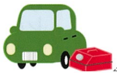
車の燃料 (ガソリン・軽油)