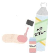
ヘアスプレー・ 化粧品など