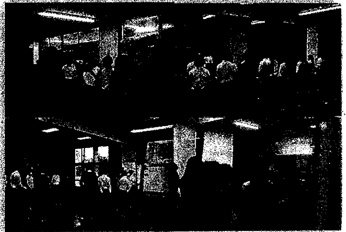
放課後練習の様子

10月30日(水)にFOSTERホールにて令和6年度合唱祭が行われました。普段の音楽の授業、朝練習、放課後練習等の取組の成果を各クラス発表しました。実行委員、指揮者、伴奏者、パートリーダー、そしてクラス全員で作ることができました。当日を迎えるまでは色々、苦労したこともあったかもしれませんが、素晴らしい合唱祭でした。(保護者の皆様におかれましては、朝練習等で普段より早く自宅を出るお子様を見守っていただきありがとうございました。)