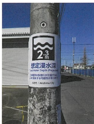
多摩川氾濫想定浸水深表示

昭島市では、多摩川は調布橋観測所の水位と、残堀川は残堀池上観測所、残堀池下観測所の水位を考慮し浸水想定区域に避難指示等各種情報を発令します