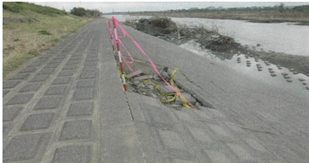
多摩川堤防のり面破損