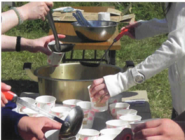
新畑子どもの広場