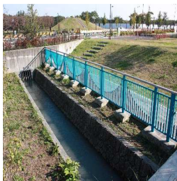
むさしの公園内の開渠

柴崎分水は、多摩大橋通りを横断する所からは、水路に蓋がされて、暗渠（あんきょ）になります。暗渠は、その先のバス通りの下を ひた 通って、むさしの公園の中に入ります。公園の端で、12m程開渠になります。すぐに新しい道路にぶつかり右折します。道路を350mほど進み、左折して、残堀川にぶつかるまで進みます。ここで、残堀川を渡ります。渡る方法は、サイホンの原理を使っています。川の下にパイプを敷設して、出口を入口より少し低くして、入口より水を流し入れます。パイプに水が満たされると、出口から流れ出るということになります。出た所は、昭和記念公園の中です。（つづく）