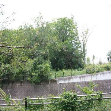
残堀川を渡る位置（手前が昭和記念公園）