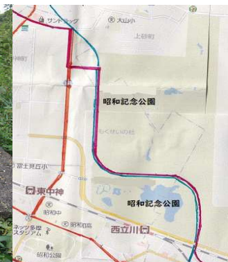
多摩大橋通りから青梅線を渡るまで