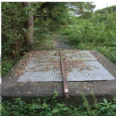
昭和記念公園への入口