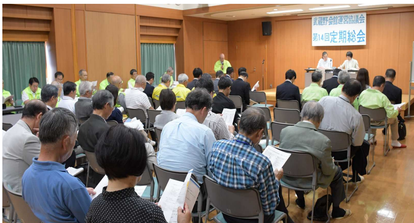
写真は第 14 回定期総会風景