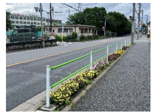
武蔵野通りの歩道に植栽された花

会館の玄関植込みと武蔵野通りに800株の花を春と秋の年2回、武蔵野小学校3年児童と武蔵野会館運営協議会役員、日の出自治会有志と協力し合い、美しい花を植える活動をしています。