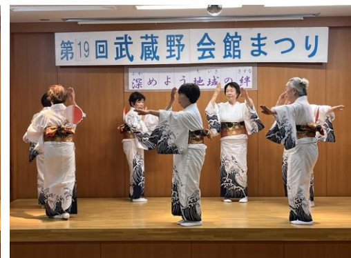
日の出シルバークラブ（新舞踊）