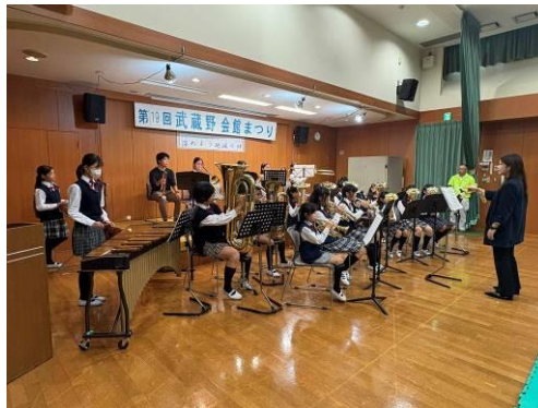
武蔵野小学校課外音楽クラブ （楽器演奏）