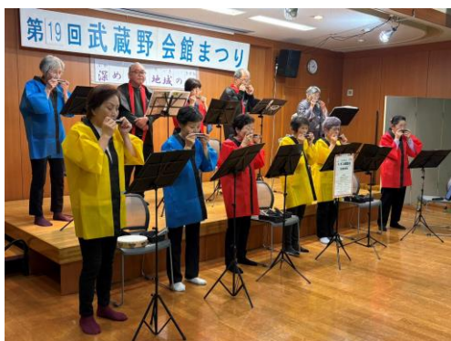
昭島ハーモニカクラブ