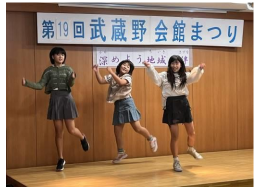
つつしが丘小学校 ダンスクラブ