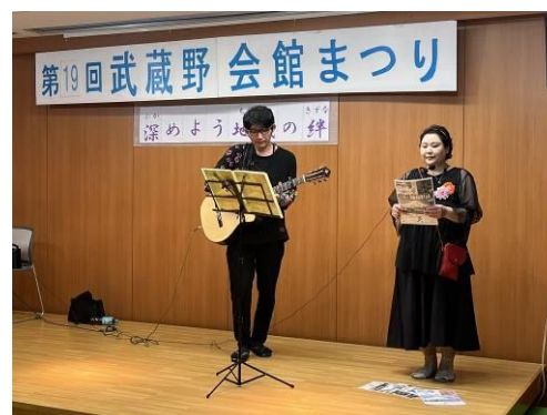
昭和音戯会 （ギター弾き語り）