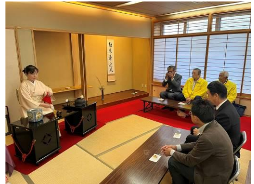
わかばの会（お茶席）