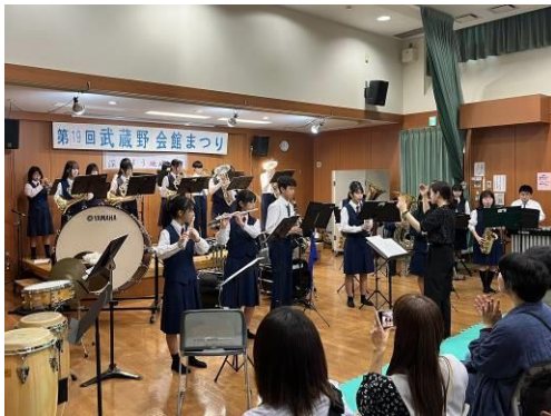
瑞雲中学校吹奏楽部