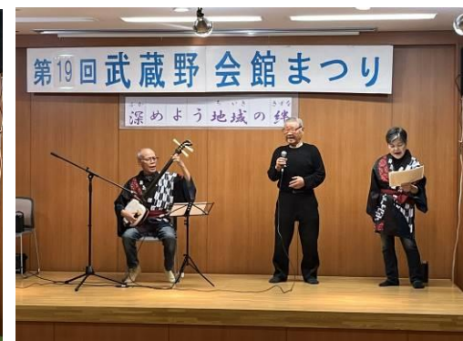
民謡サロン ゆうみん会