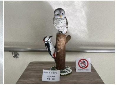
バーデン昭島シニアクラブ (絵画・木工品)