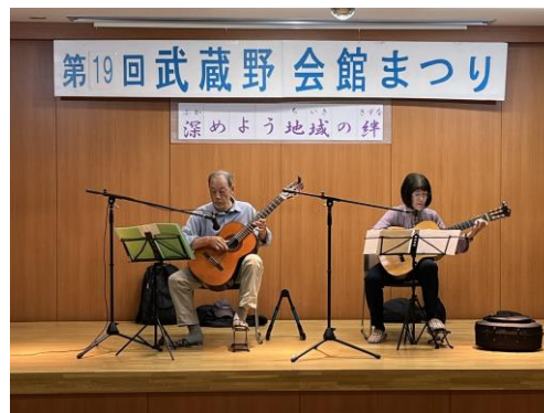
アリギリス（ギター二重奏）