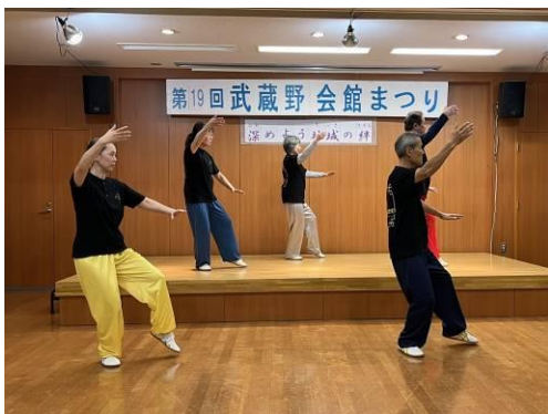
チーム金龍（太極拳）