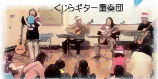
くじらギター重奏団

お申込・お問合せは、(社福)昭島市社会福祉協議会 ファミリー・サポート・センター 昭島市昭和町4-7-1 保健福祉センター2階 電話 544-0388