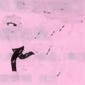
②大雨が長引くとき