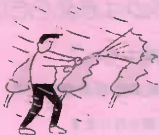
①台風が近づいているとき

風水害が発生するかもしれない「3つの気象状況」が、まさに身の回りに起こりそうな場合使います。