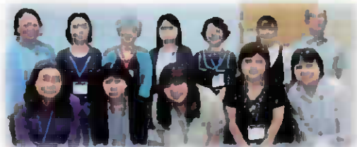
養成講習会参加者

お申込・お問合せは、(社福)昭島市社会福祉協議会 昭島市ファミリー・サポート・センター 昭島市昭和町4-7-1 保健福祉センター2階 電話 544-0388