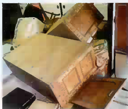
(平成30年北海道胆振東部地震の室内被害の状況)

地震で家具類が転倒・落下・移動すると、ケガ、火災、避難障害が発生する可能性があります！