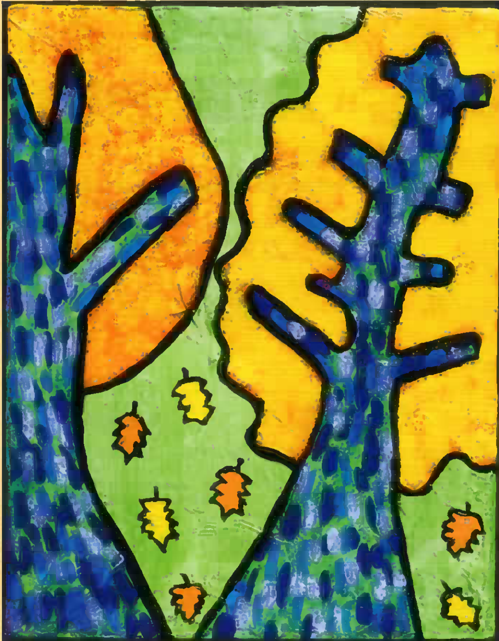
「あきのもり」 カミジヨウ ミカ Artblity ※この作品は障害者アーティストによる作品です