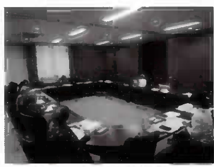
▲公民館第1会議室での活動の様子

その他の活動としては、毎年1回、句集「華もくせい」を発行しています。句集には会員の1年間の成果が収められています。句集は昭和、平成と続き、令和となった今年度で39集となります。公民館2階資料コーナーに置いてありますので、ぜひご覧ください。現在「もくせい句会」は会員を募集しています。俳句に興味のある方や、初心者の方も大歓迎、仲間づくりをしたい方もぜひ活動日にお越しください。