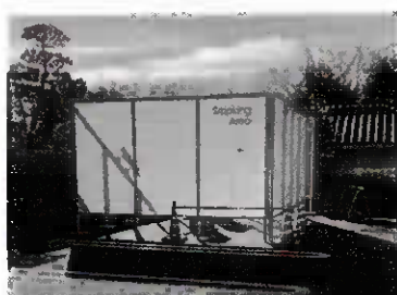
▲喫煙所 駐車場南側に設置

受動喫煙(他人の吸ったたばこの煙を周囲の人が吸ってしまうこと)による健康への悪影響を防止するため屋外駐車場南側に公衆喫煙所を設置しましたのでご利用ください。