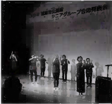
公民館内のポスター、チラシをご覧ください。

昭島市内で活動しているシニアグループ(概ね60歳以上の方で構成)が展示・舞台発表を行います。 ◆展示発表 3月14日(土)・15日(日)の午前9時30分～午後4時 場所 公民館 1階 ◆舞台発表 3月15日(日)の午後0時30分～午後4時 開場 正午 場所 公民館小ホール ※詳細は市のホームページ、